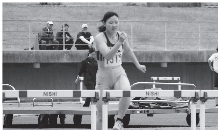
丸亀カーニバル大会 兼国スポ1次予選会