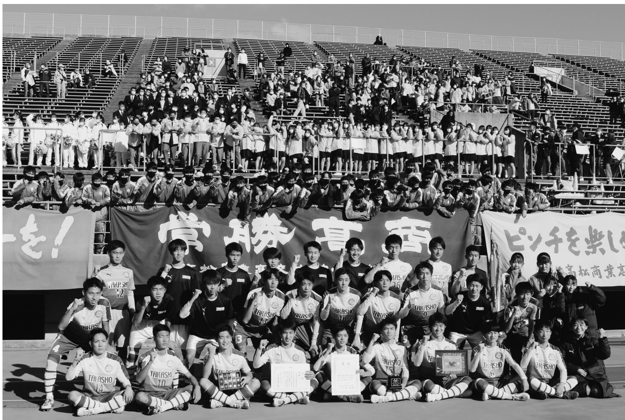
↑全国高校サッカー選手権大会 香川県大会 優勝校 高松商業高等学校