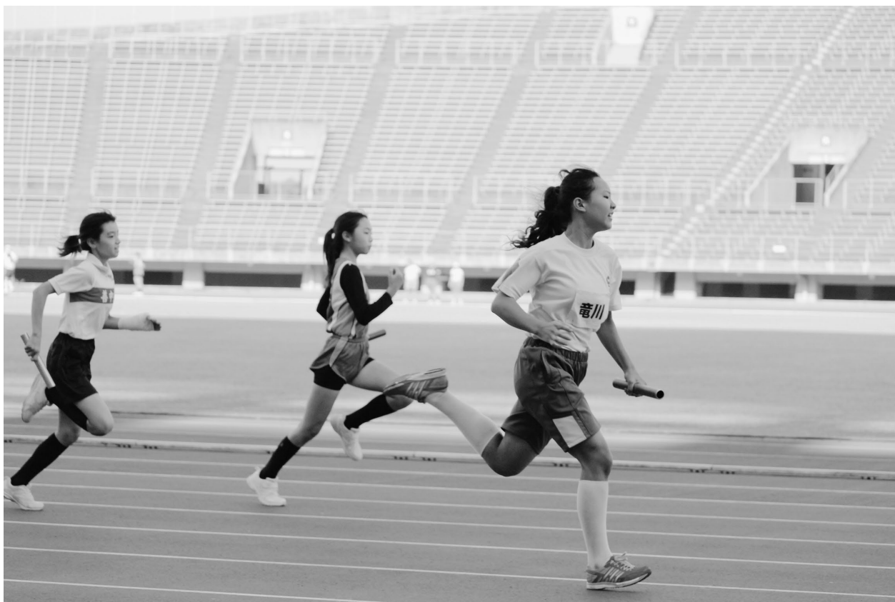
↑ 仲多度郡善通寺市小学生陸上記録会