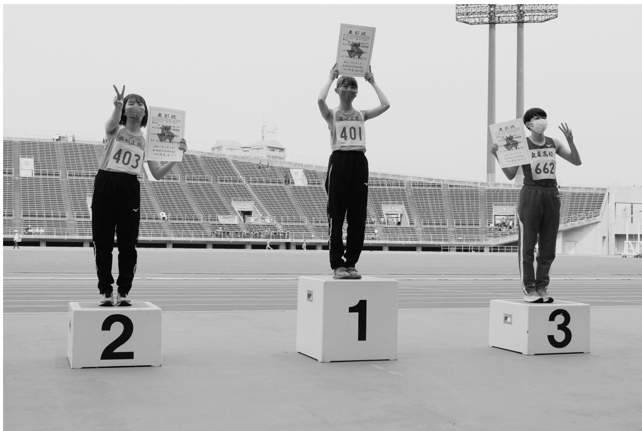
↑ 香川県高校総体陸上競技