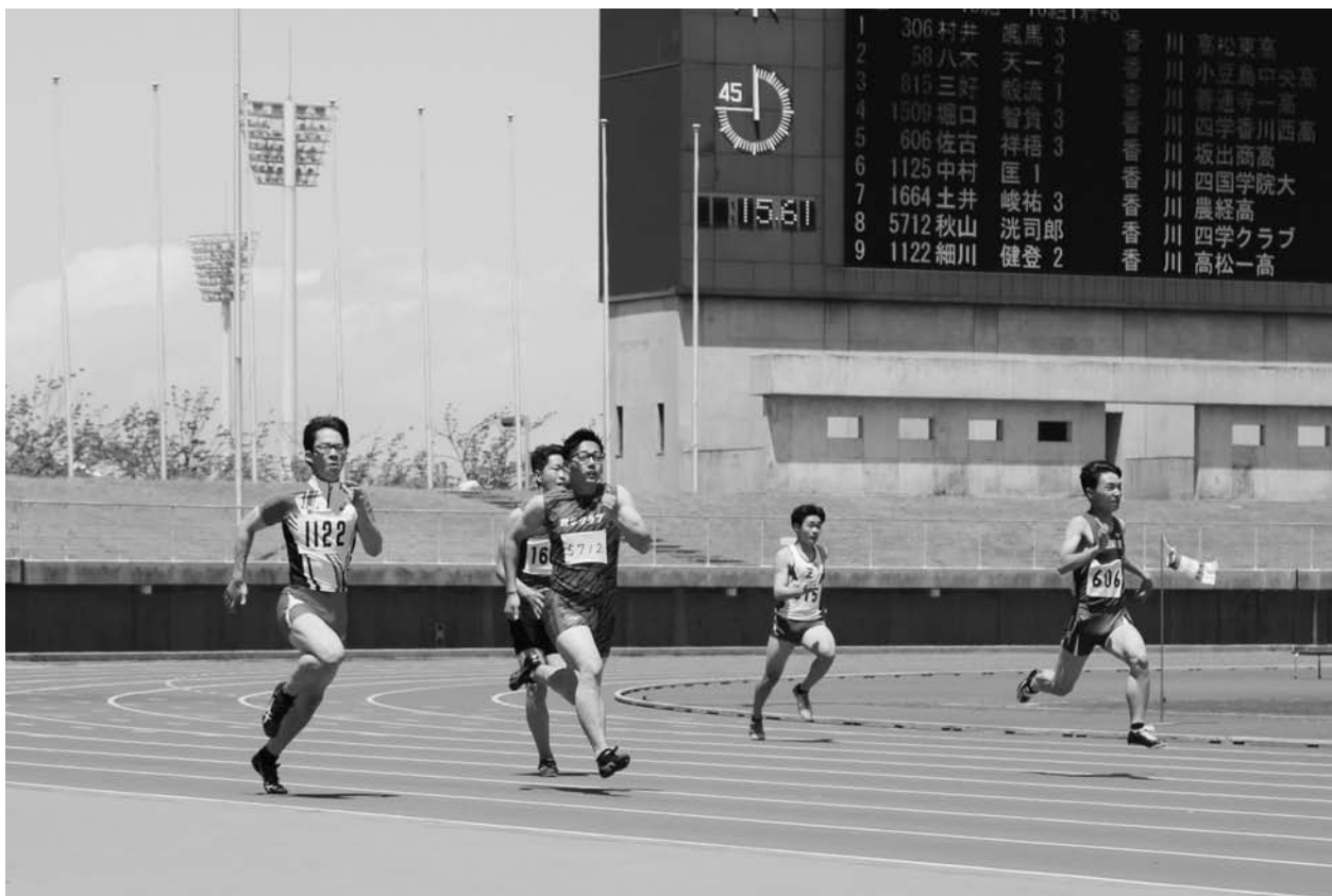
↑ 香川県陸上競技選手権大会