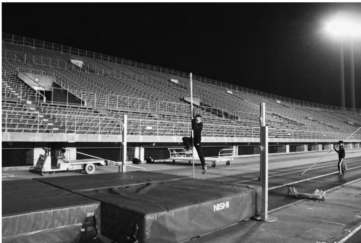
↑ 棒高跳クリニック