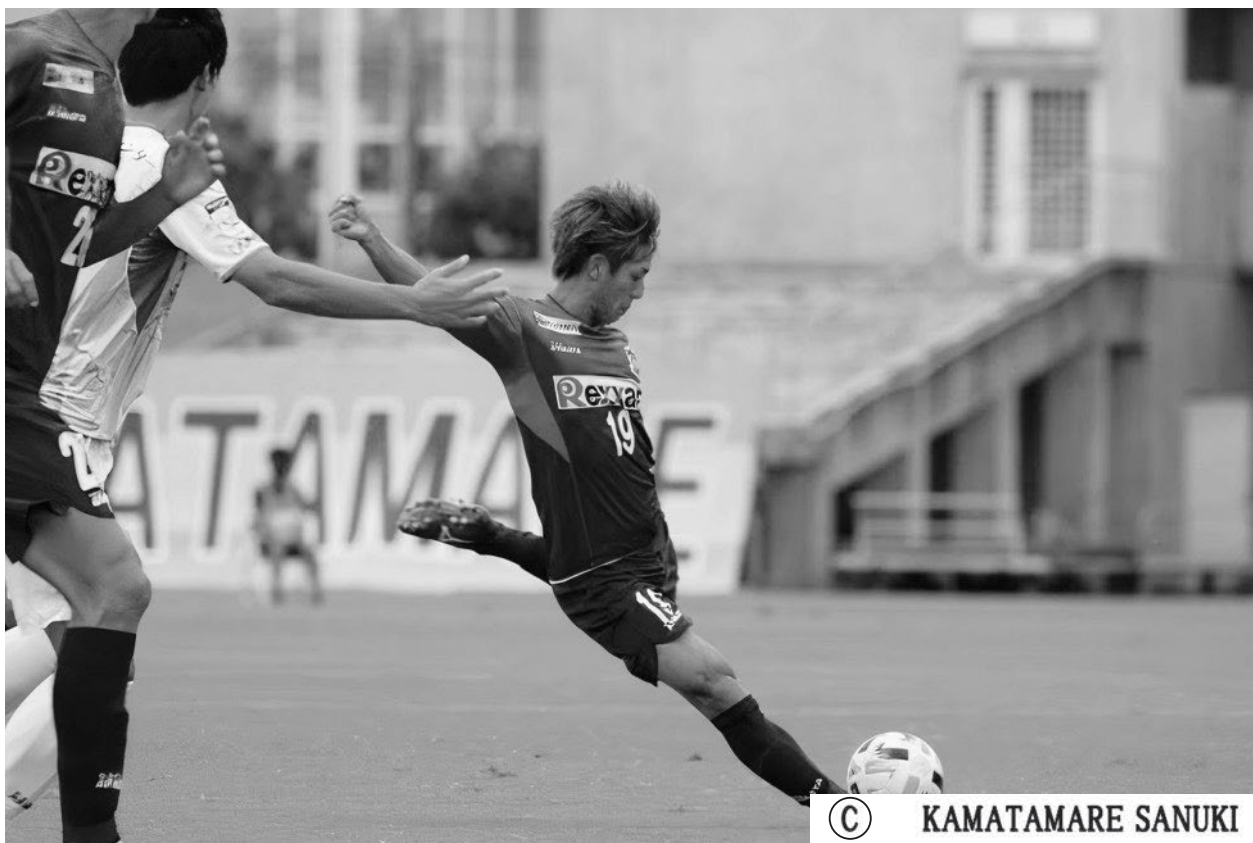
↑ 明治安田生命 J3リーグ カマタマーレ讃岐 vs ヴァンラーレ八戸