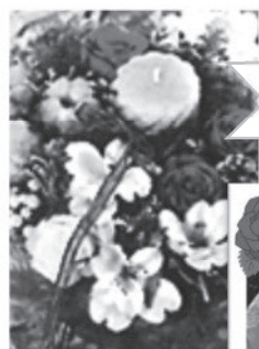
キャンドル アレンジメント