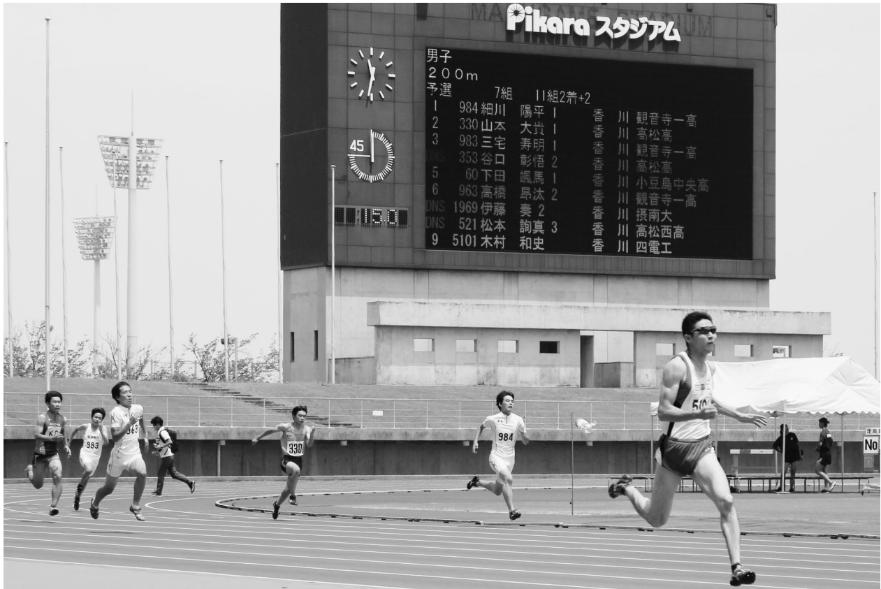
↑ 香川県陸上競技選手権大会