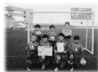
小学生優勝 丸亀城東SS(A)チーム>