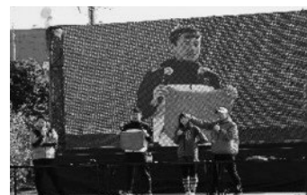
<チャリティーオークション>