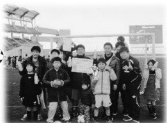
<一般優勝 FCミスターチーム