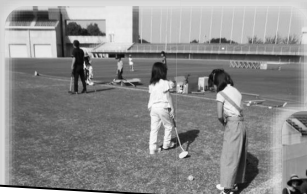
グランドゴルフ体験