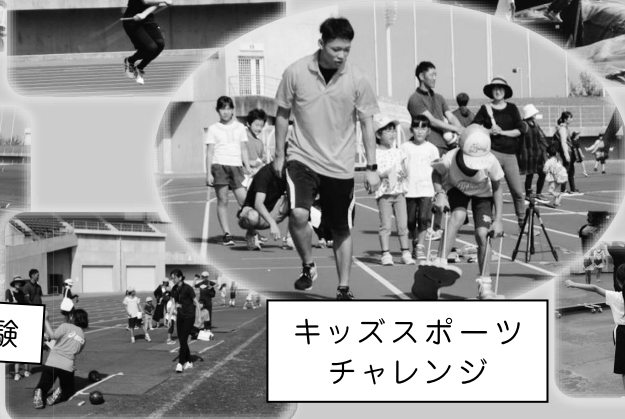
キッズスポーツ チャレンジ