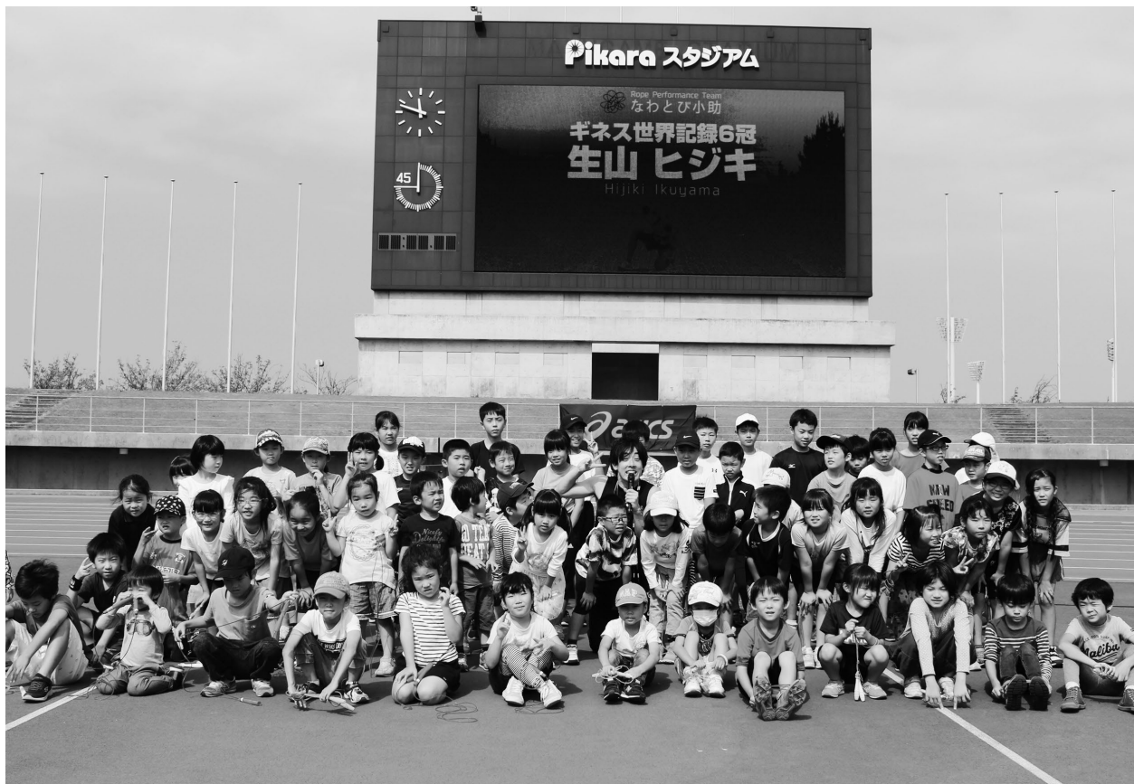
↑キッズスポーツフェスティバル なわとび教室