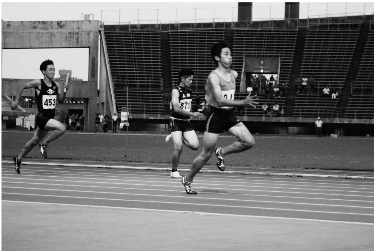
↑ 香川県高等学校新人陸上競技大会