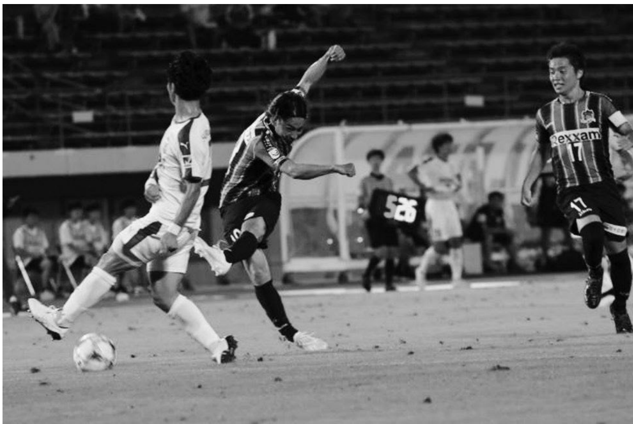
↑ 第18節 カマタマーレ讃岐 VS アスルクラロ沼津