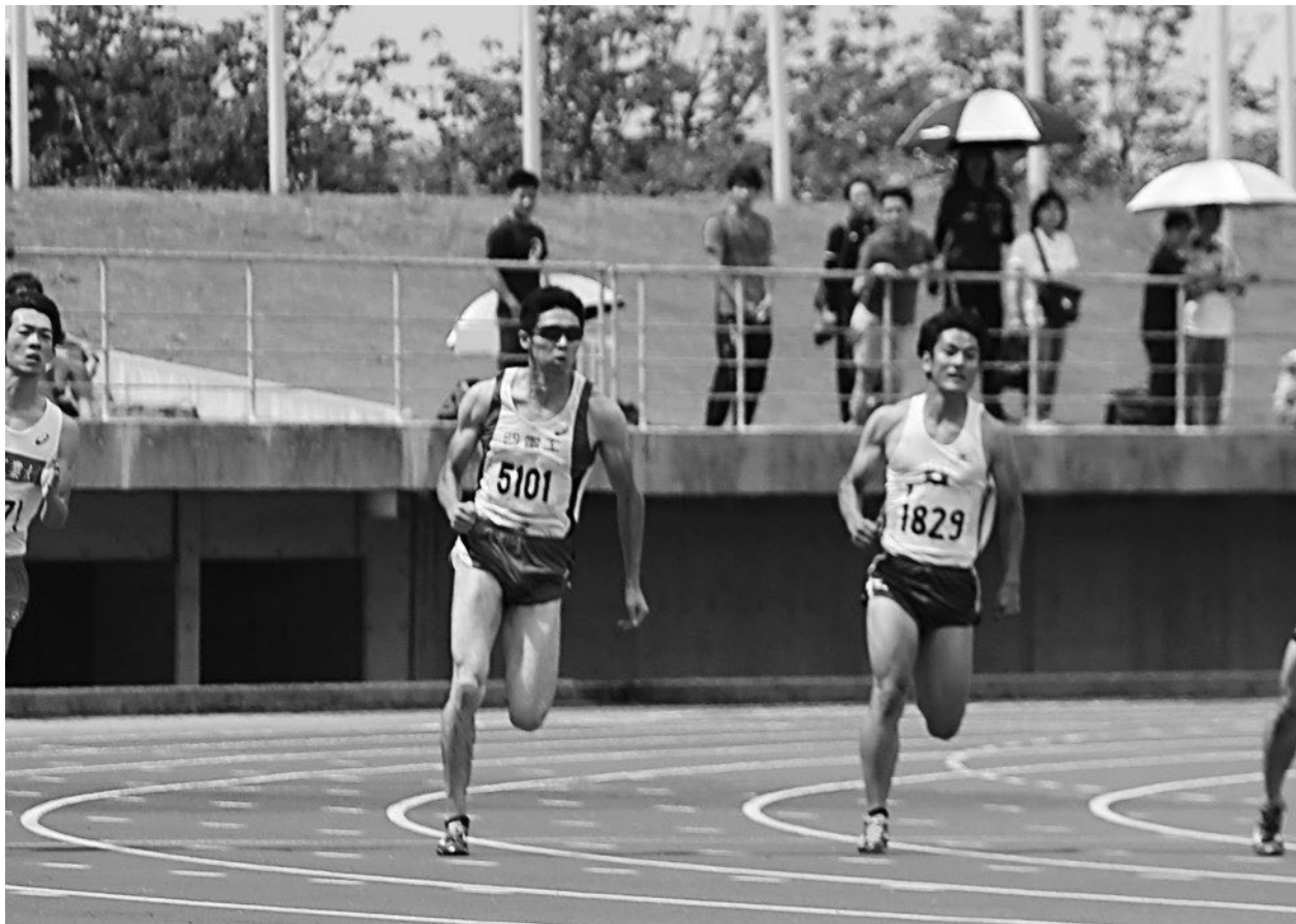
↑ 香川陸協陸上記録会 200m決勝