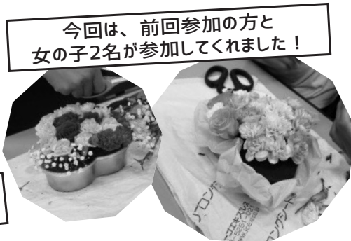
今回は、前回参加の方と女の子2名が参加してくれました！