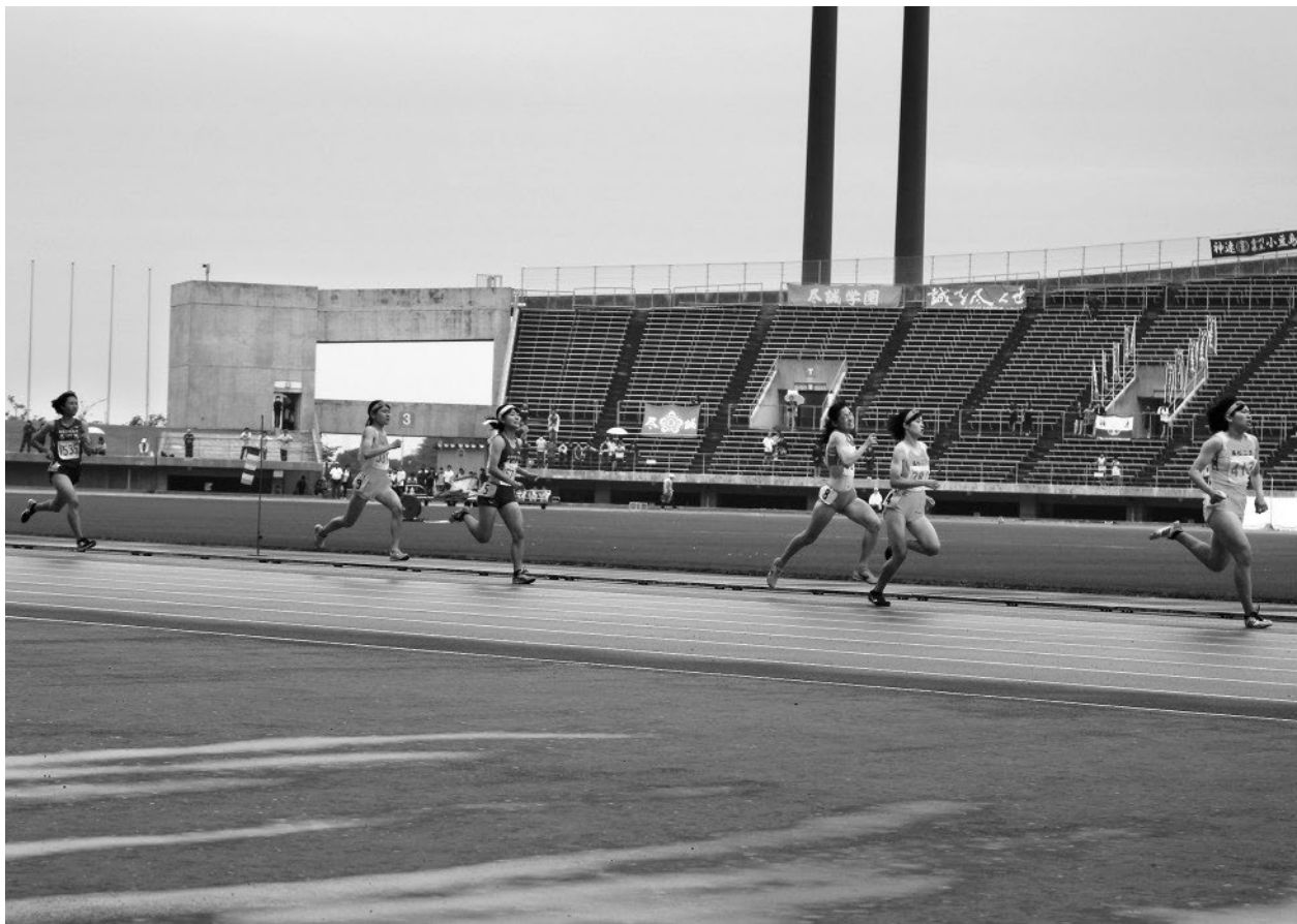
↑ 香川県高等学校総合体育大会 陸上競技