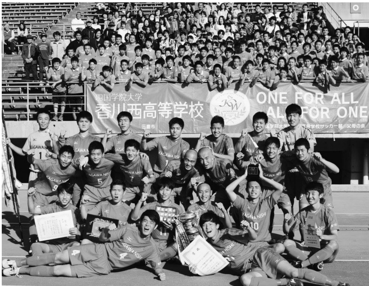
↑11月10日（日）第97回高校サッカー選手権大会 決勝