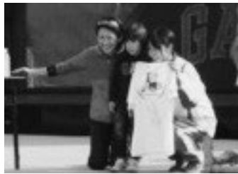
今年もチャリティーオークションを開催！