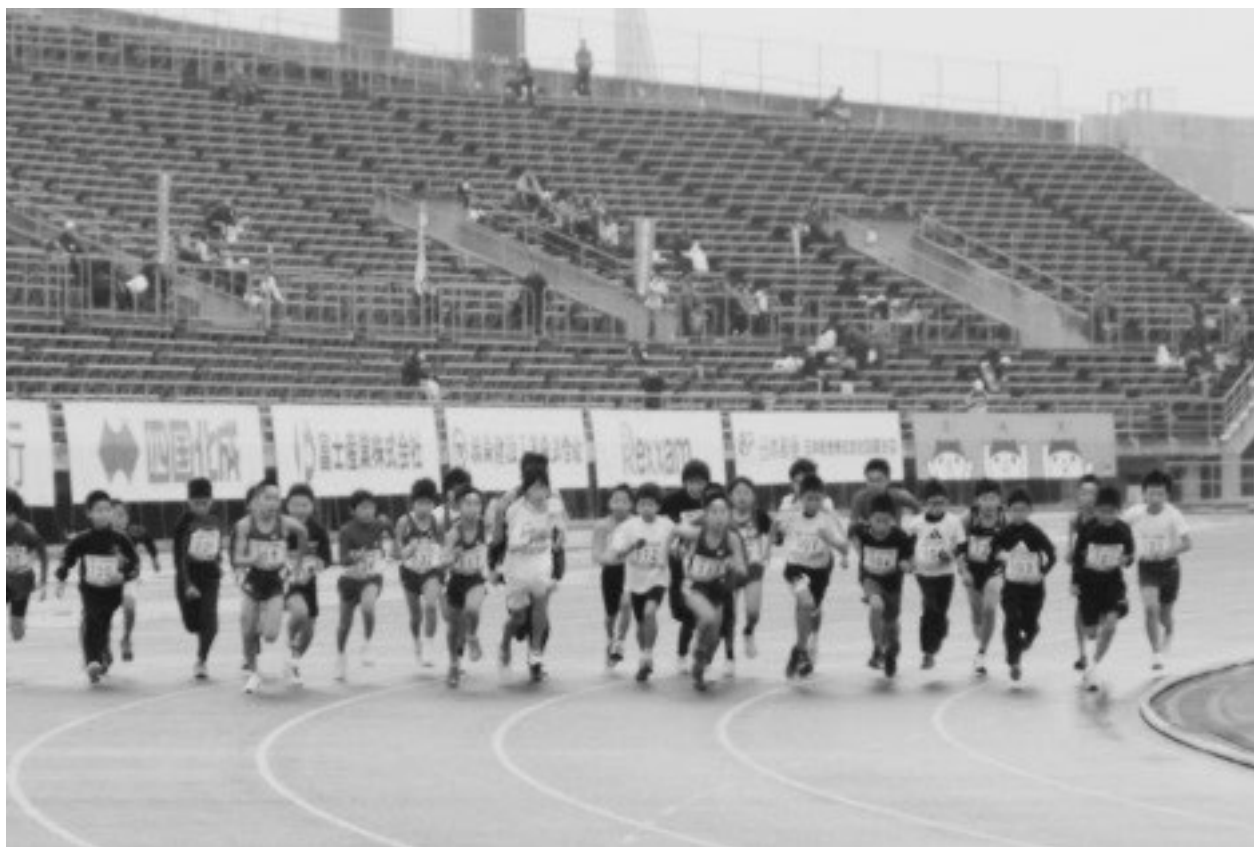
↑ 第68回 香川丸亀国際ハーフマラソン 1kmの部