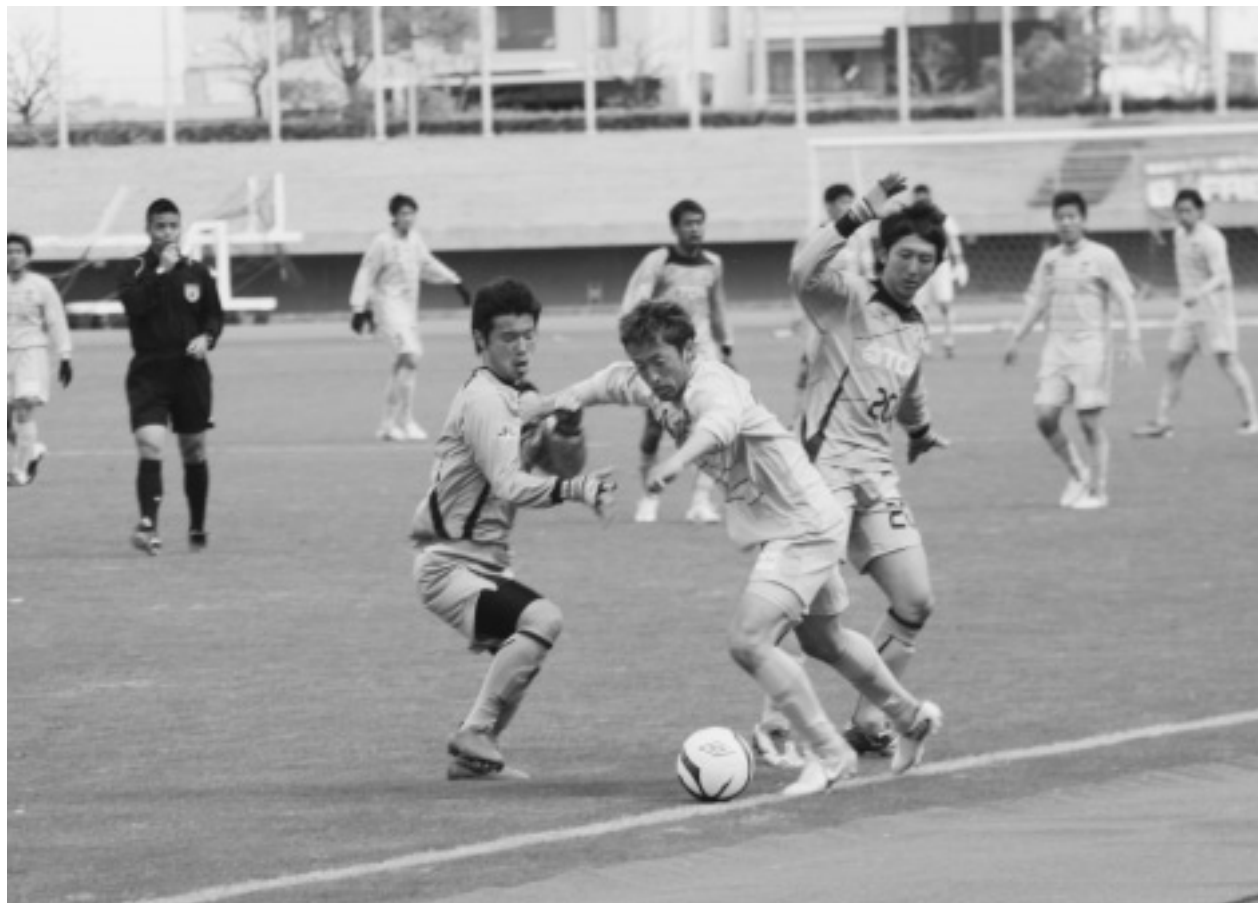
↑カマタマーレ讃岐 VS ブラウブリッツ秋田