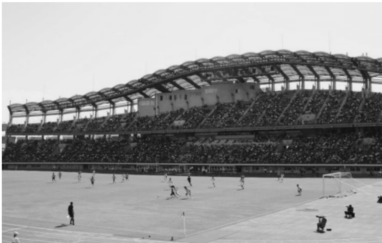
9月11日 カマタマーレ讃岐ホームゲーム【観客数 11,178人!!】