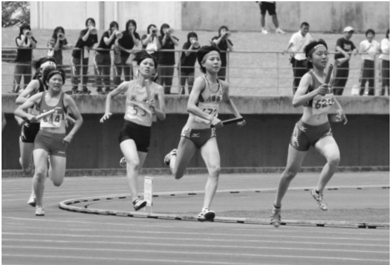
四国高等学校陸上競技対校選手権大会（6月20日～22日）